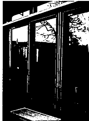
▲ 窓の開口部には網戸を!