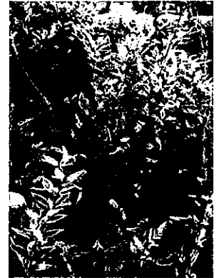
▲ やぶは刈り取りましょう