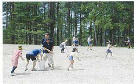
ハヶ岳水鉄砲大会

市制記念はひさしぶりの行事となりましたが天候に恵まれず水族館。今年度も地引綱挑戦します!