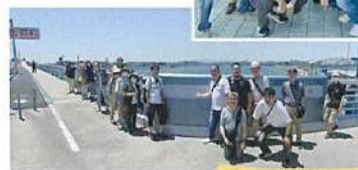
多摩川スカイブリッジ